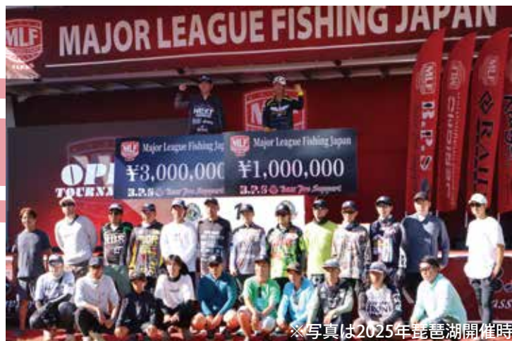
※写真は2025年琵琶湖開催時

2025年、琵琶湖で開催したMLF Japan Open Tournamentですが、2026年は福島県・桧原湖で行います。ニッポンのスマールマウスバスの聖地で、果たして、どんな熱い戦いが繰り広げられるのでしょうか。真夏の桧原湖はシャローからディープまで広範囲に魚が散るため、さまざまなパターンが求められることに加えて、1匹のウエイトがスマールマウスバスよりも期待できるラージマウスバスを狙うことも視野に入れた展開が予想されます。いわゆる「ミックスバッグ」が、ハイウエイトを叩き出すカギとなりそう。もちろん、注目選手にカメラが同船し、ライブ配信も実施予定！ 2026年夏、MLF Japanが東北を熱くします。