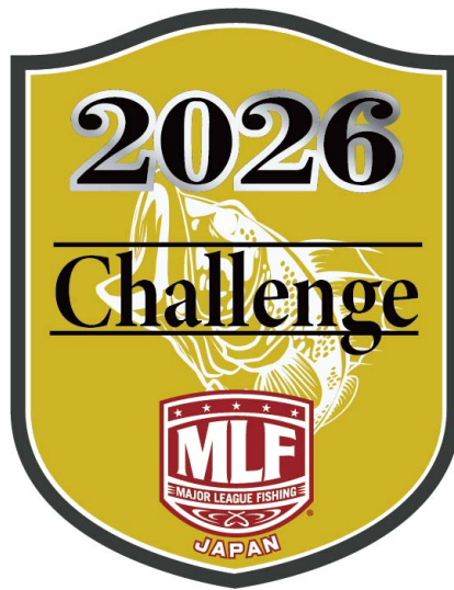
MLF Japan Challenge ロゴ