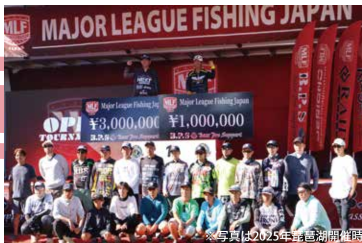
※写真は2025年琵琶湖開催時

2025年、琵琶湖で開催したMLF Japan Open Tournamentですが、2026年は福島県・桧原湖で行います。ニッポンのスマールマウスバスの聖地で、果たして、どんな熱い戦いが繰り広げられるのでしょうか。真夏の桧原湖はシャローからディープまで広範囲に魚が散るため、さまざまなパターンが求められることに加えて、1匹のウエイトがスマールマウスバスよりも期待できるラージマウスバスを狙うことも視野に入れた展開が予想されます。いわゆる「ミックスバッグ」が、ハイウエイトを叩き出すカギとなりそう。もちろん、注目選手にカメラが同船し、ライブ配信も実施予定！ 2026年夏、MLF Japanが東北を熱くします。