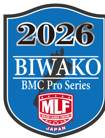
Biwako BMC Pro Series ロゴ